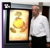
KOMEMORACIJA U PETAK Preminuo redatelj Tomislav Radić

KULTURNA POLITIKA | KNJIŽEVNOST | KNJIŽEVNA KRITIKA | KNJIŽEVNA NAGRADA | FILM | DOKUMENTARCI | KAZALIŠTE | IZLOŽBA