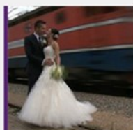
DOKUART ŠIRI KULTURU Veliki dan Đure Gavrana bit će prikazan u zatvoru