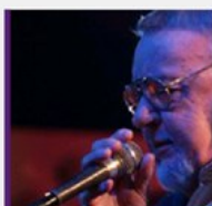
JAZZ.HR Velikani domaće i svjetske jazz scene u Zagrebu