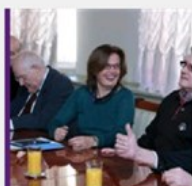
RIJEČ KULTURNJAKA Zašto Zagrebu treba samostalni ured za kulturu