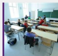
POTICANJE ČITANJA Hoće li strategija uspjeti ispraviti kulturu nečitanja?